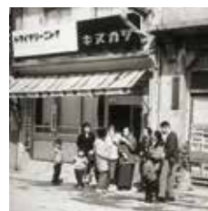
昭和 30 年代の本店店舗

カバンストリート カバンショップや工房が 建ち並ぶ全長約 200m の商店街。通りには全国 でも豊岡にしかないカバ ンの自動販売機が設置 されています。