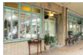
現在の本店舗外観